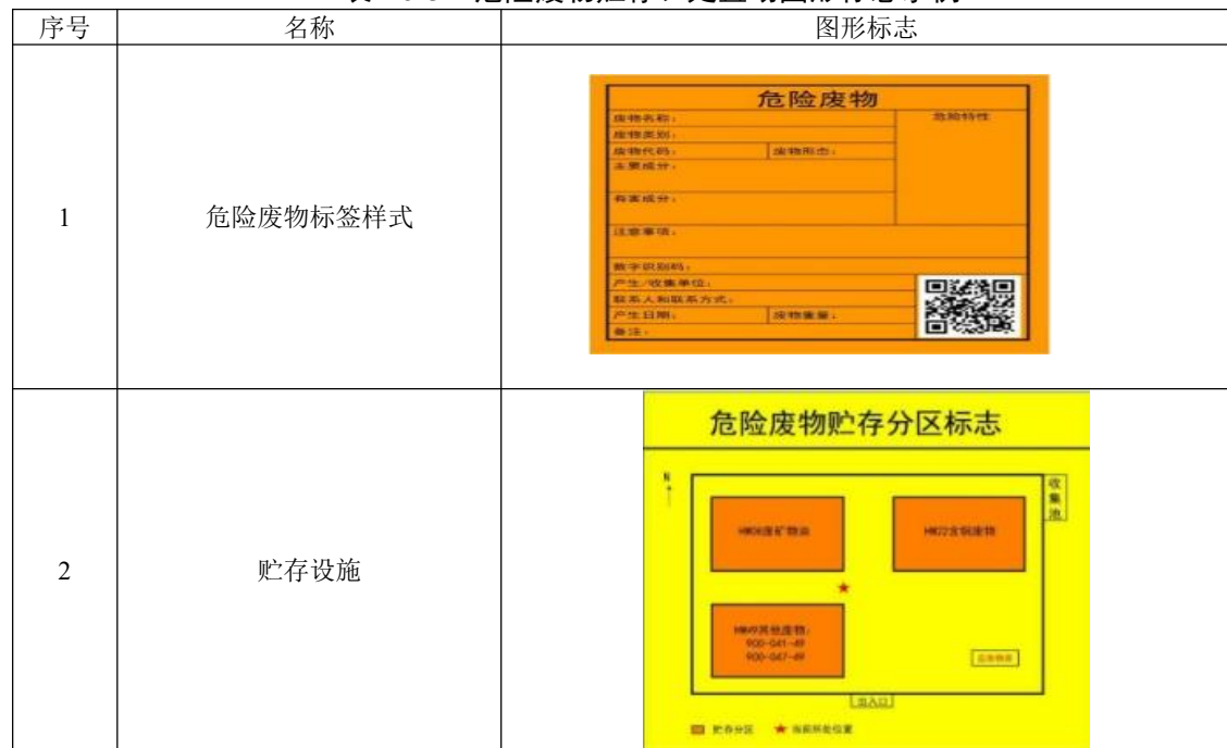
表 4.5-3 危险废物贮存、处置场图形标志示例

⑥作好危险废物情况的记录。记录上须注明危险废物的名称、来源、数量、特性和包装容器的类别、入库日期、存放库位、废物出库日期及接收单位名称。危险废物的记录和货单在危险废物回取后应继续保留3年。