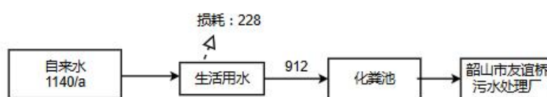
图 2.3-1 水平衡图